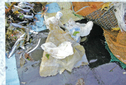
漁師さんの網にかかった海洋ごみ