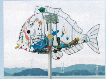
湊・大新田/海ごみアート