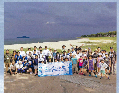
今治ブルークリーンプロジェクト