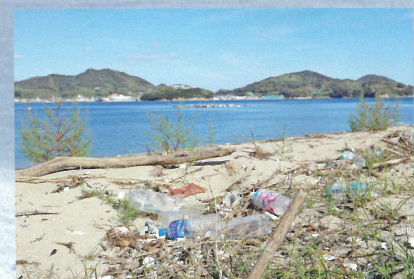
海岸に流れついた海洋ごみ(今治市 鶴島)