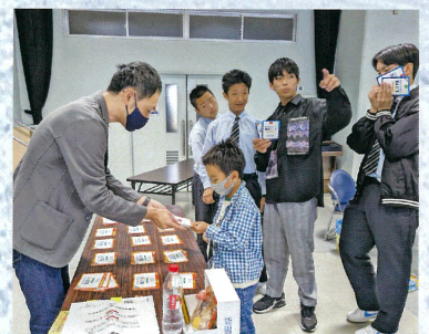
海洋ごみ問題解決カードゲーム