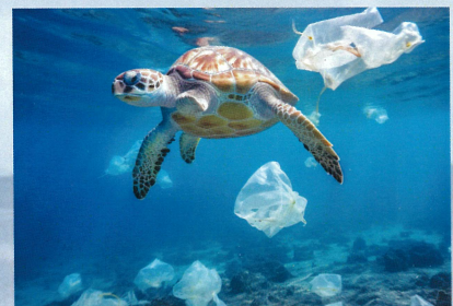
海の生き物への影響

海の生き物が「マイクロプラスチック」をエサと間違えて食べてしまい、生態系への影響が心配されています。