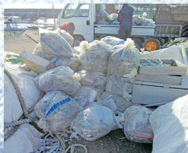
漁師さんの取組み