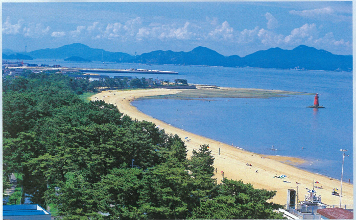
唐子浜海岸/白砂青松

愛媛県は全国でも5番目に長い海岸線を持ち、その愛媛県の中でも今治市の海岸は、最も長い海岸線なんだ。そこには、ながい歴史のなかで育まれた自然豊かな美しい海岸線が存在するんだ。この美しい海や海岸を守るためにみんなで一緒に考えてみよう!