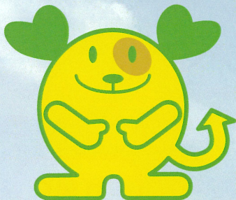
今治市3R推進キャラクターあーるん