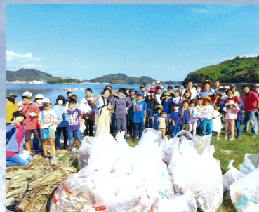
ビーチクリーンしまなみ